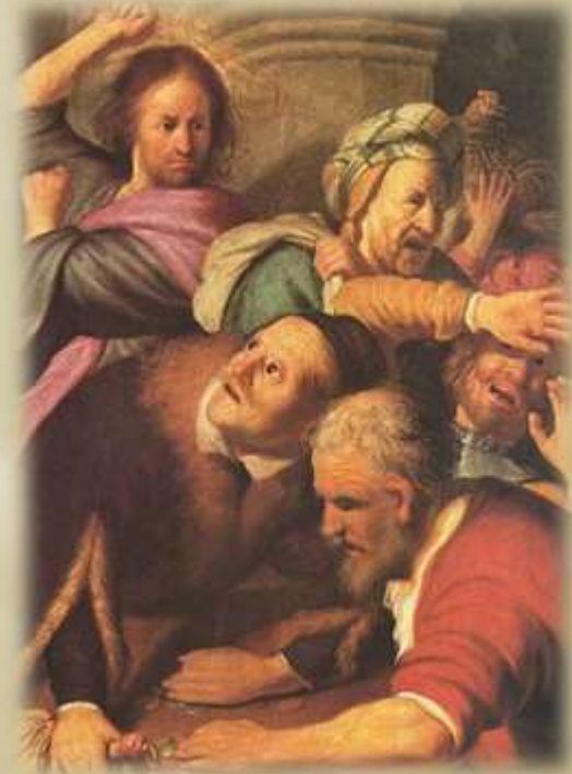
Christus vertreibt die Wechsler aus dem Tempel (Rembrandt van Rijn 1626)