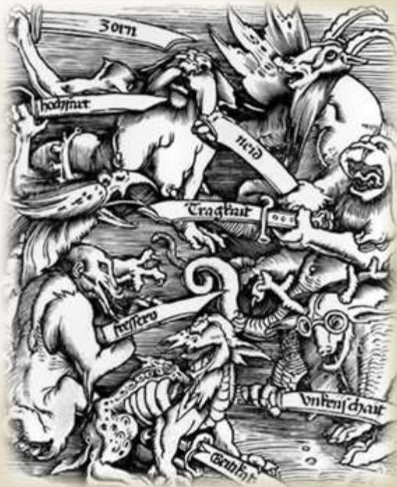
Die Sieben Todsünden (Hans Baldung Grien 1511)